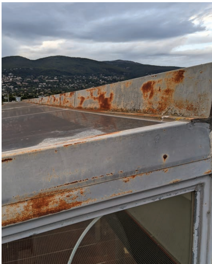
En plus des joints vieillissants, le dôme est aujourd'hui attaqué par la rouille.