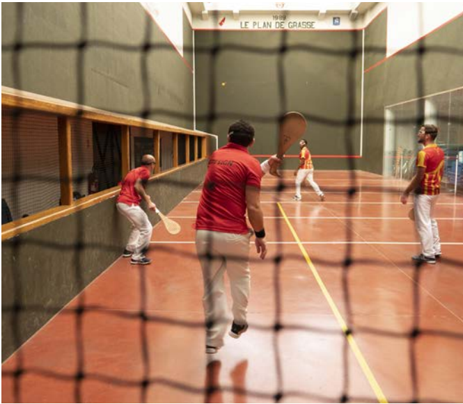
Lors du championnat de ligue PACA-Corse