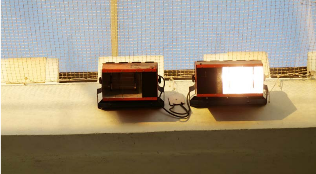
Le système actuel ne marche qu'à moitié