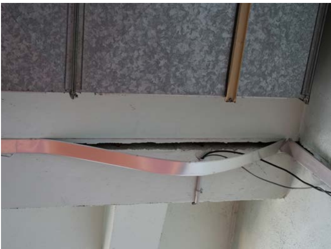
Les joints métalliques se déchaussent à l'étage.