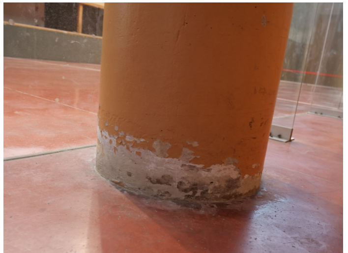
En de nombreux endroits il faut intervenir.