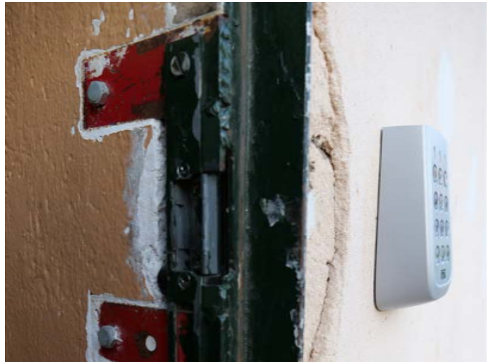
Reparation de fortune sur la porte d'entrée.