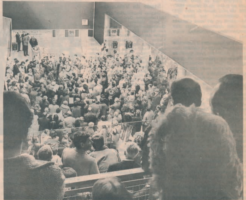
L'intérieur de ce trinquet... en souhaitant qu'il connaisse désormais souvent une telle affluence