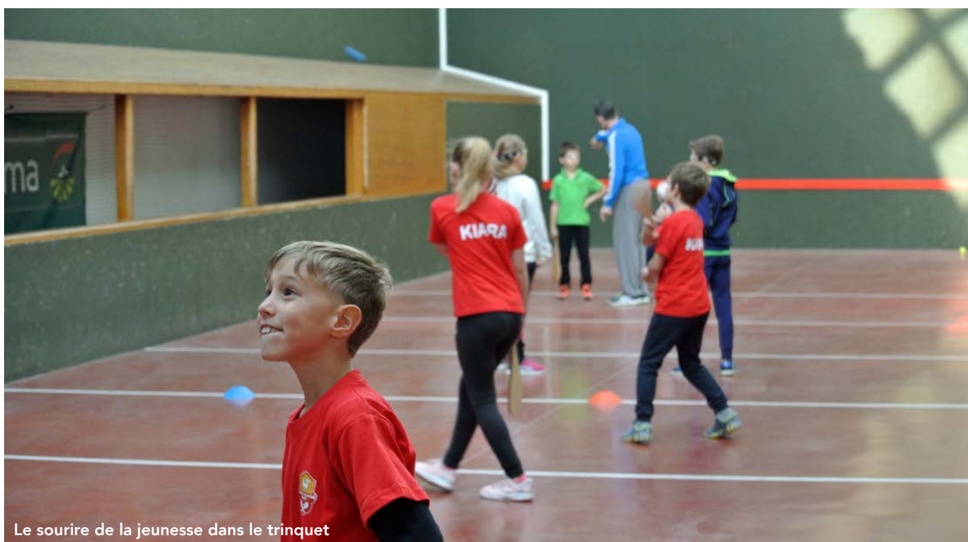
Le sourire de la jeunesse dans le trinquet

Alors qu'on note une concentration de trinquets dans le sud-ouest, celui du Plan est le seul exemplaire au sud-est.