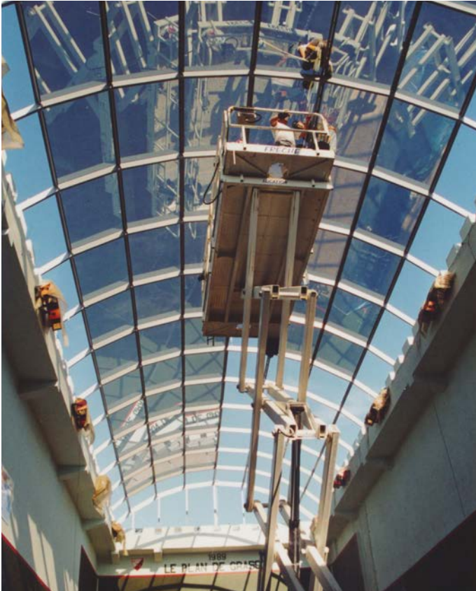
Montage du dôme il y a plus de vingt ans.