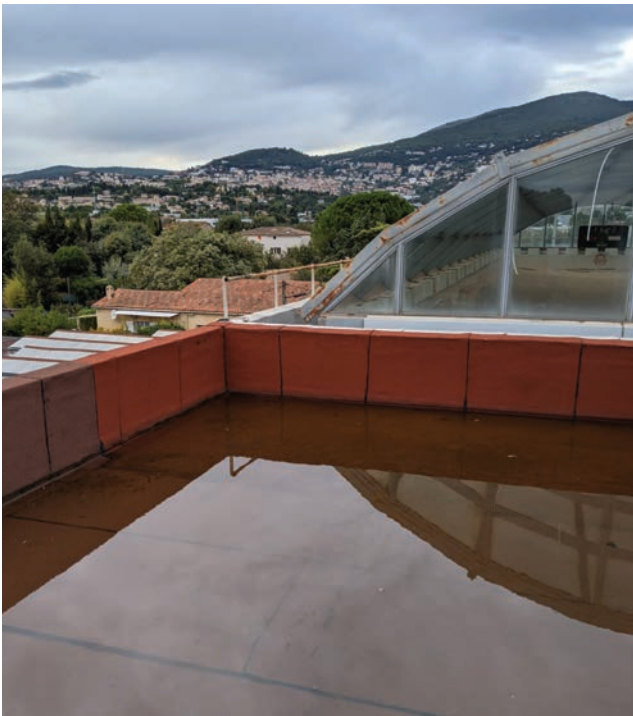
La partie plane de l'édifice n'évacue plus efficacement l'eau de pluie.