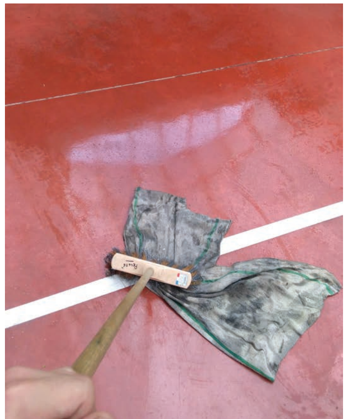
La serpillière, une solution qui ne fait que masquer la dangerosité de la surface mouillée.