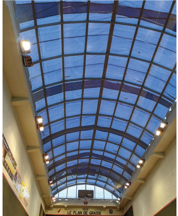
En 2019, afin d'assurer la tenue du championnat de ligue PACA, nous avons installé en urgence plusieurs bâches fortunes sur le toit.