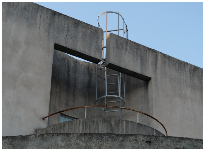
La façade extérieure a bien triste allure.