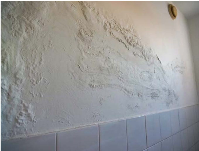
La moisissure se propage dans les toilettes des vestiaires.