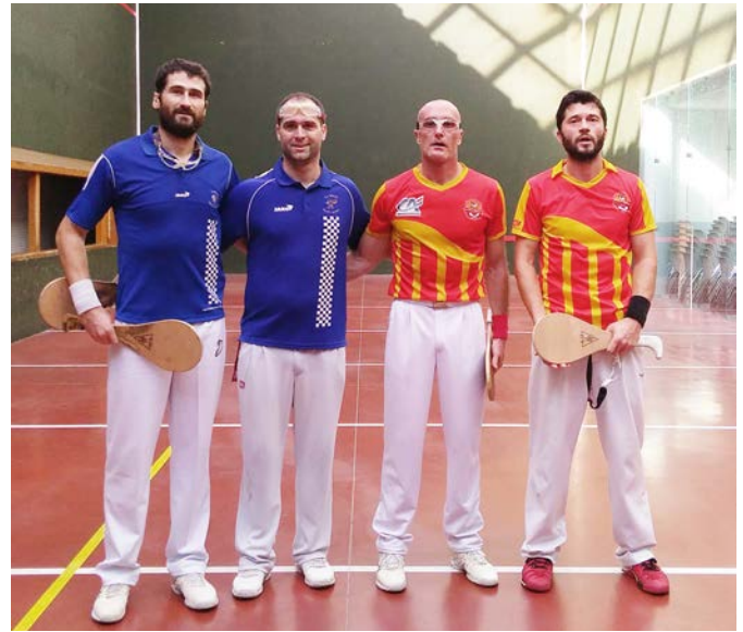
Présentation des joueurs lors du championnat de France National A (Bordeaux-Bègle contre Grasse)