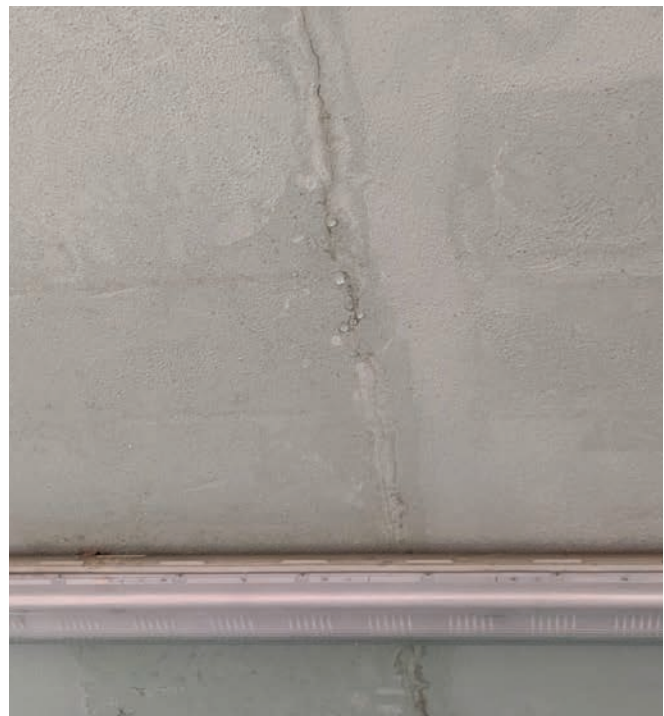
Des infiltrations sont apparues sur le plafond des tribunes.