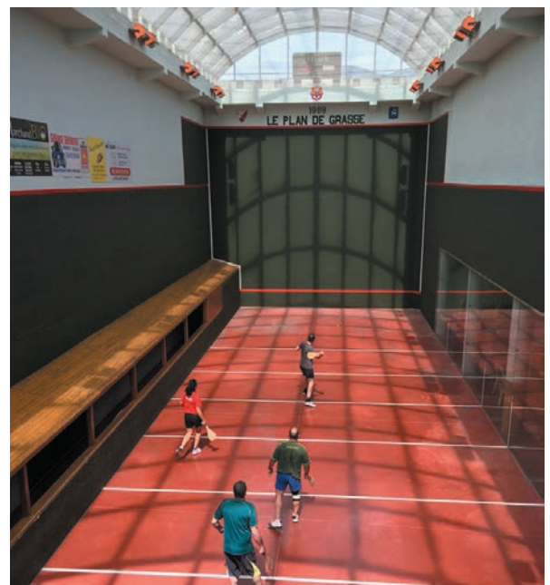
Le trinquet, dans les années 90, était impeccable.