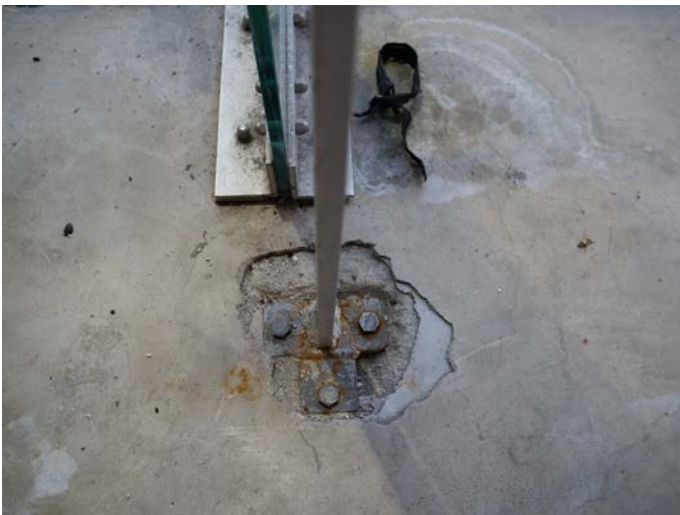
La structure des garde-corps de la tribune se fragilisent.